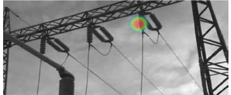
Beispiel für die Beurteilung des Schweregrades für Si124-IPS

Die FLIR Si124-PD ist ein einfach zu bedienendes, eigenständiges System zur Erkennung von Teilentladungsproblemen in elektrischen Hochspannungsanlagen. Diese leichte und einhändig zu bedienende Lösung wurde speziell für Konstruktionsexperten entwickelt, die damit Probleme bis zu zehnmal schneller erkennen können als mit herkömmlichen Methoden. Mit ihren 124 Mikrofonen erzeugt die Si124-PD ein präzises akustisches Bild, das Ultraschallinformationen auch in lauten Umgebungen über weite Entfernungen visuell darstellt. Das akustische Bild wird in Echtzeit auf ein digitales Kamerabild überlagert, sodass der Benutzer die Schallquelle genau lokalisieren kann. Der Benutzer kann dann mithilfe der FLIR Advanced Severity Assessment-Analyse den Schweregrad des Problems klassifizieren und Empfehlungen für Maßnahmen zur Lösung des Problems geben. Die Si124-PD verfügt über ein Plugin, mit dem der Benutzer akustische Bilder zur Offline-Bearbeitung, Analyse und erweiterten akustischen und thermografischen Berichterstellung in die FLIR Thermal Studio Suite importieren kann. Die Analyse und Berichterstellung vor Ort kann auch über den Cloud-Dienst FLIR Acoustic Camera Viewer erfolgen. Durch eine regelmäßige Wartungsroutine können Einrichtungen mithilfe der FLIR Si124-PD Geld für Reparaturen einsparen und die Zuverlässigkeit ihrer Anlagen erhöhen.